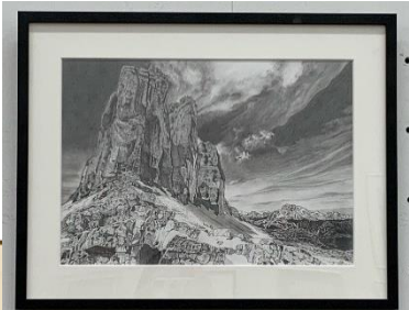
トレ・チーメ岩山群 水間裕