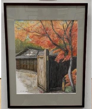
秋彩(国営昭和記念公園) 三谷泰久