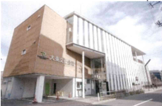
大東文化会館 外観